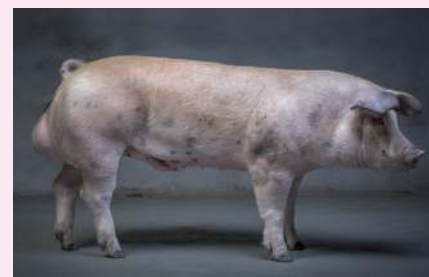
Verrat TN Traxx

La semence de verrats TN Traxx est disponible dans vos centres d'insémination Gènes Diffusion et Yxia.